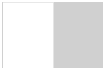
Einzelseite 165 mm b x 220 mm h + 3mm Beschnitt