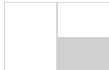
Halbe Seite 165 mm b x 110 mm h + 3mm Beschnitt

Anzeigengestaltung: 2/1 Seite: 55,- € * • 1/1 Seite: 35,- € * • inkl. 2 Designvorschlägen und 1 Korrekturlauf.